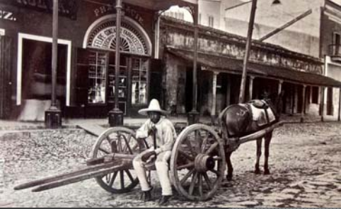
Carretonero, Tampico, Ca., 1905