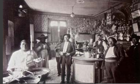
El templo del amor, Pulquería, México, D.F., 1926