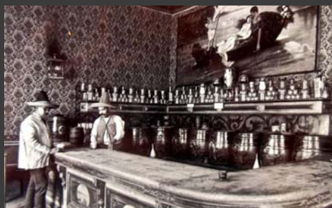
Pulquería, México, Ca., 1900, Charles B. Waite, Colección La fotografía en México