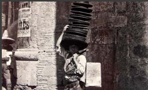
Vendedor de sombreros, Guadalajara, Charles B. Waite ca., 1900, Colección de La fotografía en México