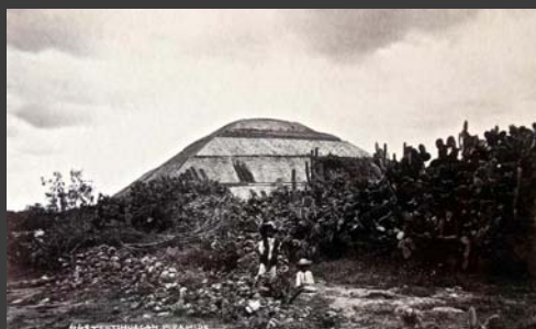
Pirámide del Sol en Teotihuacán, Estado de México, Hugo Brehme, ca., 1930, Colección de La fotografía en México