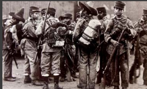
Tropas federales antes de salir hacia la Laguna, para combatir a revolucionarios constitucionalistas, México, Ca., 1913, Archivo Casasola, Colección La Fotografía en México