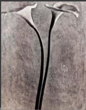
Alcatraces, Tina Modotti, 1926, Colección de La fotografía en México