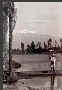
Canal de Tláhuac, al fondo el Iztaccíhuatl, México, D.F., ca., Hugo Brehme, 1930, Colección de La fotografía en México