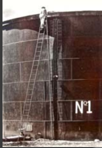
Tanque No. 1, Tina Modotti, 1925, Colección la fotografía en México