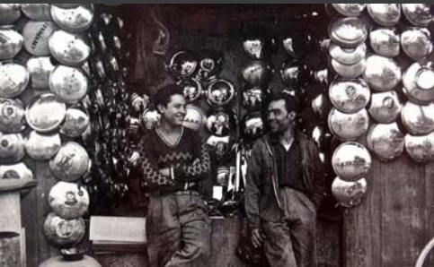
Vendedores de tapones para rines, México, D.F., Nacho López, 1956, Colección de La fotografía en México