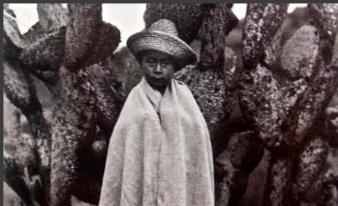
Niño con jorongo, Tina Modotti, 1930, Colección La fotografía en México