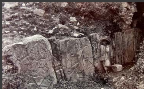
Basamento de los Danzantes, Monte Albán, Oaxaca, Oaxaca, ca., 1930