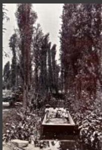
Niños indígenas en Xochimilco, Xochimilco, México, D.F., 1930, Hugo Brehme, Colección de La fotografía en México