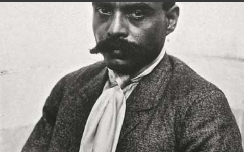
Emiliano Zapata, jefe de la División del Sur, México, Ca., 1912