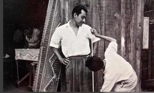
Colonia Nonoalco, México, D.F., Nacho López, 1955, Colección de La fotografía en México