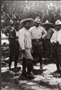
Francisco Villa acompañado del general Baltazar Quiñones y el Coronel Benítez Delgado, después de su rendición, Sabinas, Coahuila, 28 de julio de 1920