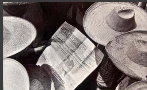
Campesinos leyendo El Machete, 1929, Tina Modotti