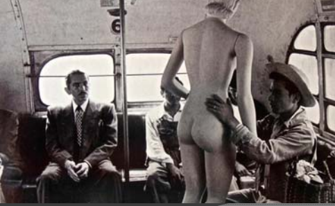
La Venus de Juerga, México, D.F., Nacho López, 1950, Colección de La fotografía en México